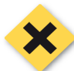
Artículos peligrosos Dangerous items