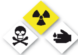
Sustancias químicas y tóxicas Chemical and toxic substances