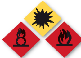
Sustancias explosivas e inflamables Explosive and flammable substances